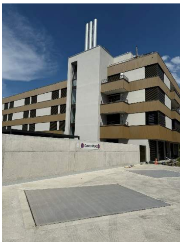
Holzeinfüllöffnung und Kaminanlage