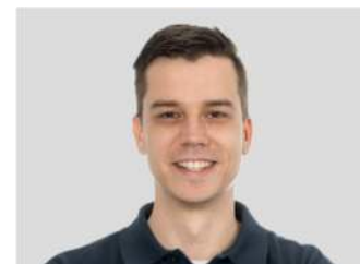
Christian Stahn Netzbetrieb